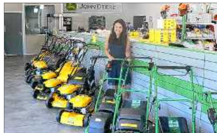
Agri 68 vient d'ouvrir à Hattstatt un site très accueillant.

L'une des antennes de la société Agri 68, dirigée par Emmanuel Nebout, vient de quitter Gundolsheim, où elle était implantée depuis près de trente ans, pour la zone artisanale de Hattstatt. Un choix de développement stratégique.