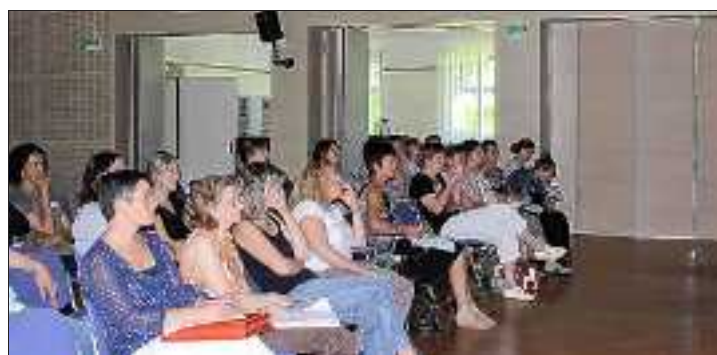
La prise en charge de la personne âgée a été au centre du colloque organisé dernièrement au centre hospitalier par le Réseau Alsace Gériatrie.

La prise en charge des personnes âgées et personnes atteintes de la maladie d'Alzheimer est au centre des préoccupations des professionnels du secteur de la gérontologie. Les acteurs soignants du territoire de proximité de Colmar/Guebwiller ont abordé ces difficultés lors d'un colloque qui s'est tenu jeudi au centre hospitalier de Rouffach.