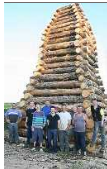
Le bûcher a été érigé en trois jours par une dizaine de bénévoles.

■ Y ALLER Feu de la Saint-Jean à Osenbach, piste de motocross, accès fléché, organisé par le MCCO samedi 15 juin à partir de 19 h.